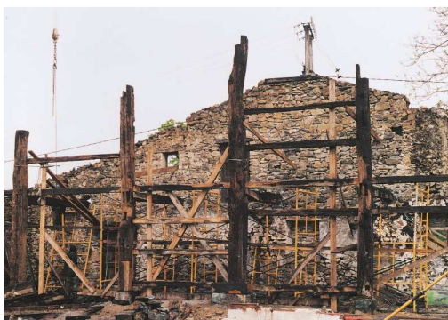
Egitura berriro muntatzen

Bigarrenik, zaharberritzea amaitzen ari zela lan taldearen bilera batera joan nintzen sukalde inguruko lurrei buruz hitzegitera. Egun horretan torlojuaren presioaren lehen froga burutu zen eta segurtatu dezaket lehen bi bueltak eman zitzaizkionean, egurraren karraska entzuten hasi zenean... korrikan ihes egiteko modukoa izan zela!!!! Sinestezina zen duela 500 urte eraikitako neurri horietako makina bat toki berean eta ia pieza berdinekin entzuten egotea.