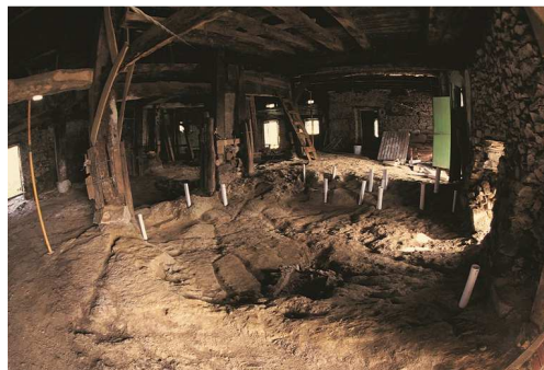
Lurpean barneratuta dagoen Erdi Aroko etxolagunearen neurriak, eraikinaren ekialdeko alboan ixten zuten zutabeen kokapenarekin.

ezagutzan zeresan handia duela defendatzen du.