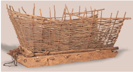
Lera bere prozelarekin