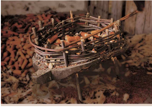
Artoa jotzeko astoa