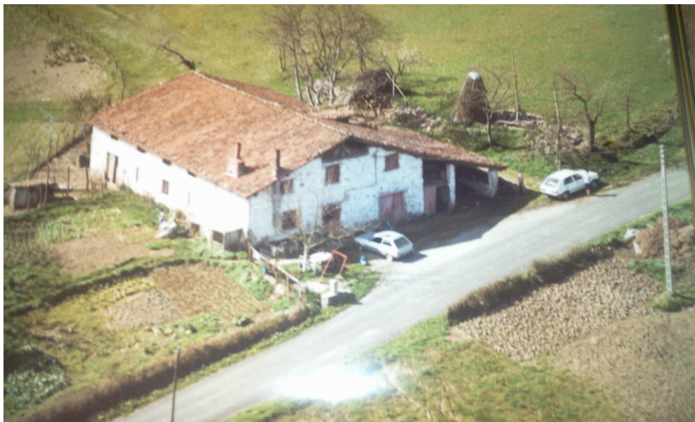
Igartuerdi baserria berri aurretik.