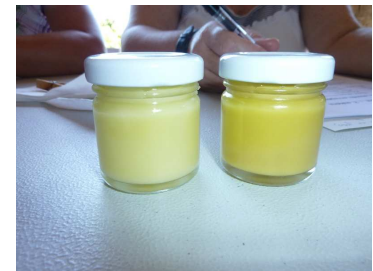
Itziar Salegiren eskutik, ukenduak egiten ikasteko tailerra.