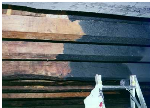
Sukaldean zarakar beltza ematen

enkargua baloratu gabe onartu nuen, erronka gisa. Dena den, behin hasiera eman genionean eta zailtasunak izan arren, bagenekien lortuko genuela.