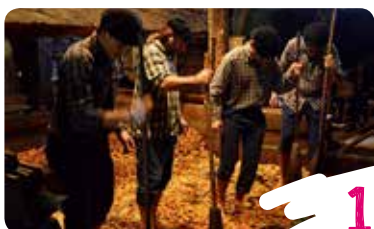
PISOIEZ SAGARRA JO (SAGARRA TXIKITU)