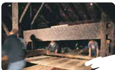
PATS-OHOLAK JARRI (OHOL LAUK TXORROEN GAINEAN)