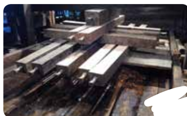
GILTZAK JARRI ETA PIRAMIDEA OSATU