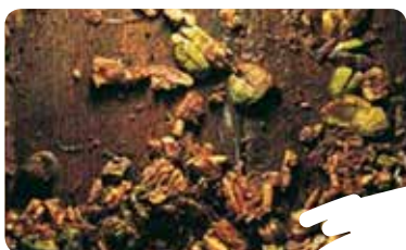
PATSA BILDU (JOTAKO SAGARRA BILDU)