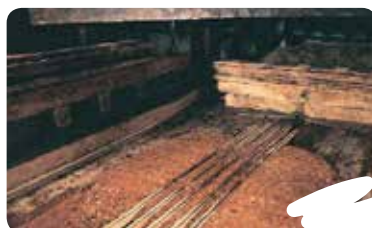
TXORROAK JARRI (HODI LUZEAK PATSAREN GAINEAN)