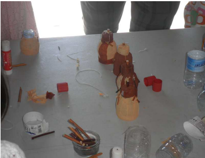
Belar-meta tailerra, Ekoguneak eskainia.