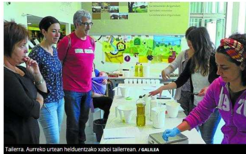
Tallerra. Aurreko urtean helduentzako xaboi tallerrean.