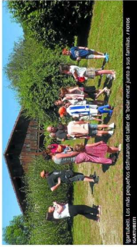
Igartubeiti. Los más pequeños disfrutaron del taller de 'belar-metel' junto a sus familias.

La flora del lugar y los productos de la huerta fueron los protagonistas de la conferencia de Jakoba Errekondo